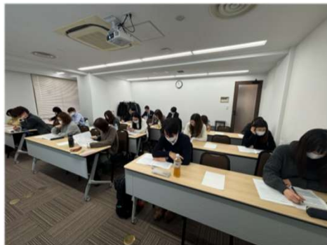
1/16 丸1日6時間かけて行った業務改善研修の様子

当社では中期経営計画で掲げた目指す姿「カイゼンの専門家集団」の実現に向け、全社レベルでカイゼン力の底上げに取り組んでいます。1月に全国から選抜メンバー17名が集結し、業務改善の基礎と実践を体系的に学ぶ「業務改善研修」を開催しました。受講者からは、これまでの「現状の不便さの解消」から、今後は「お客様のビジネス成果につながる改善」へと意識や観点が変わったといった声が上がっています。